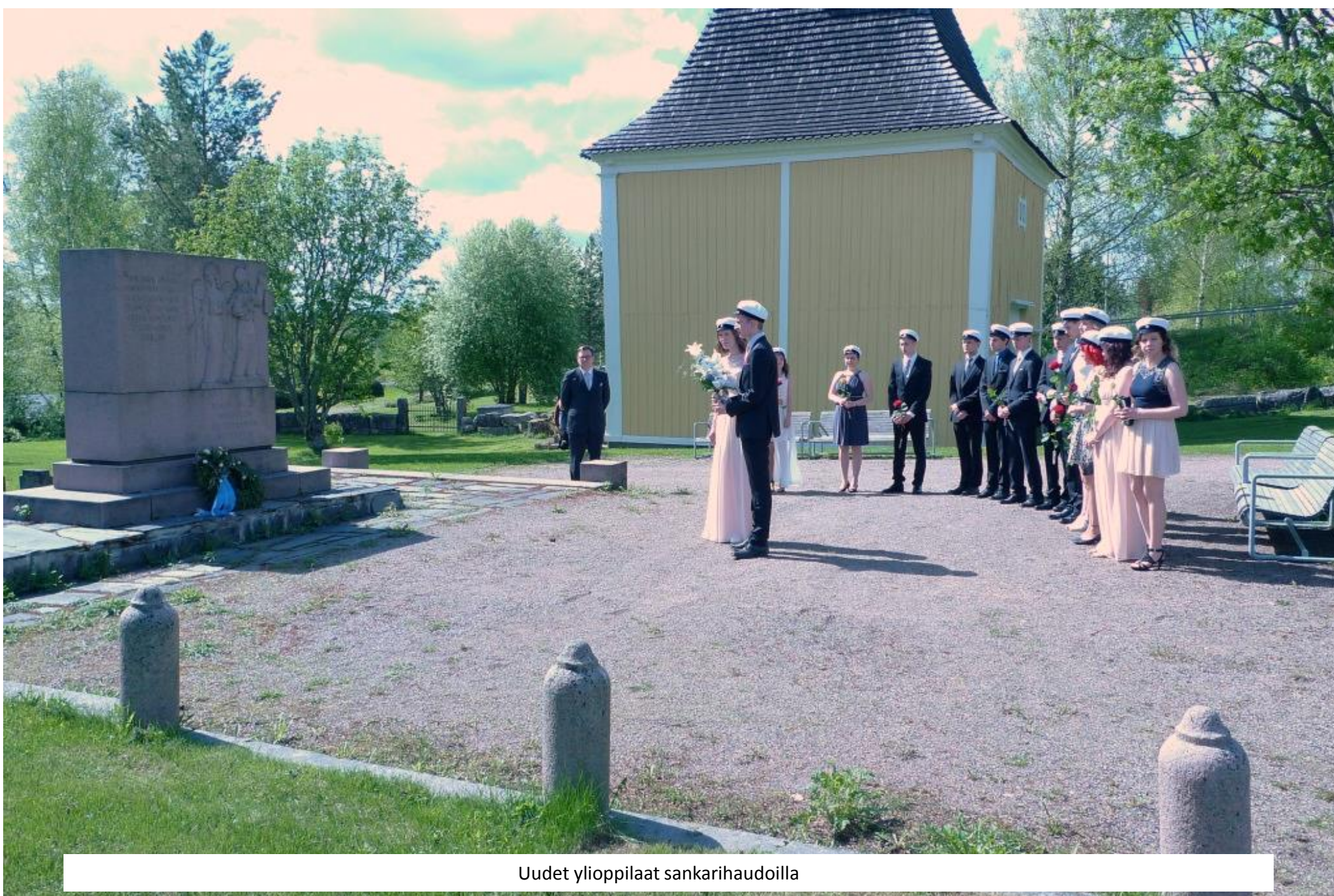
Uudet ylioppilaat sankarihaudoilla