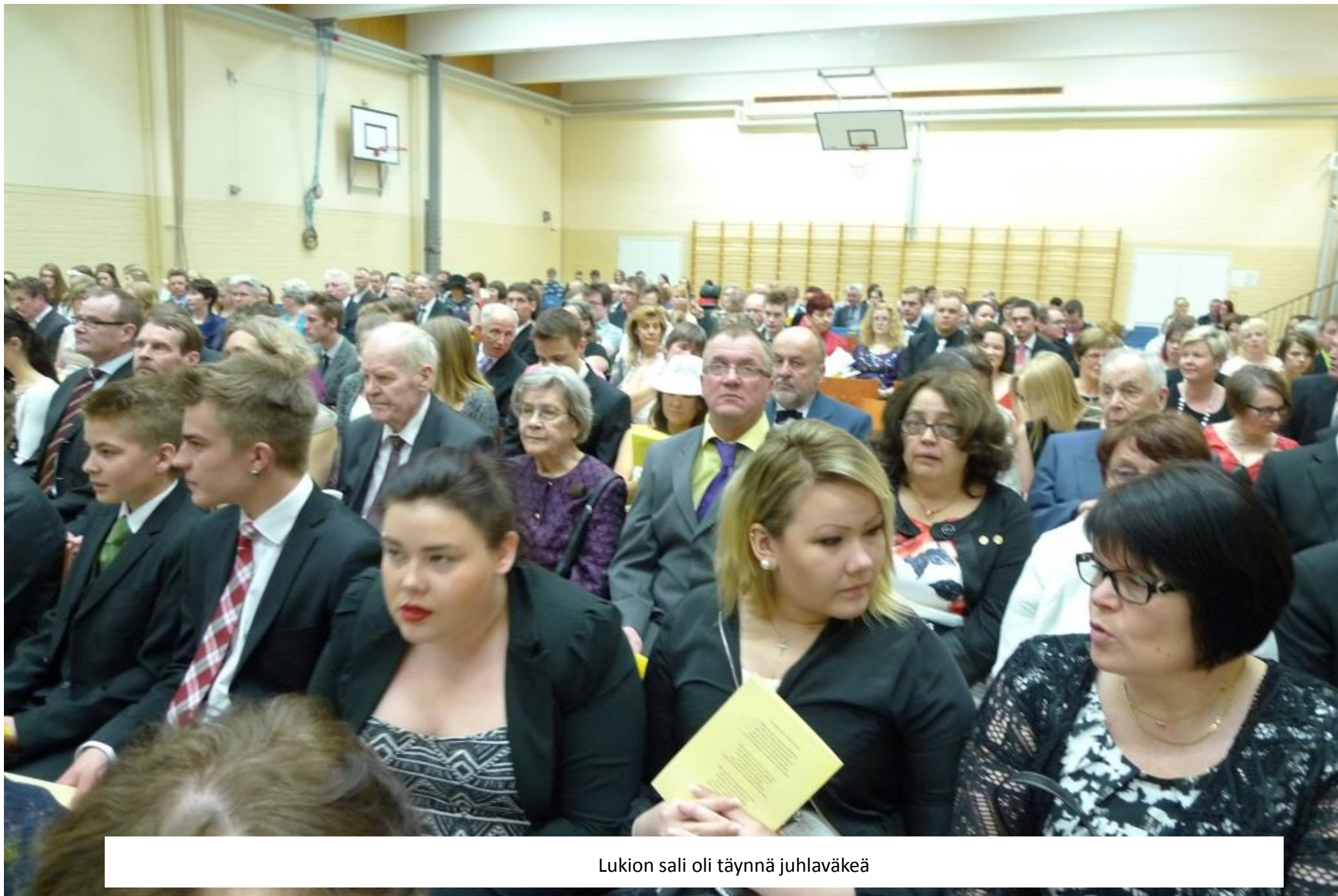
Lukion sali oli täynnä juhlaväkeä