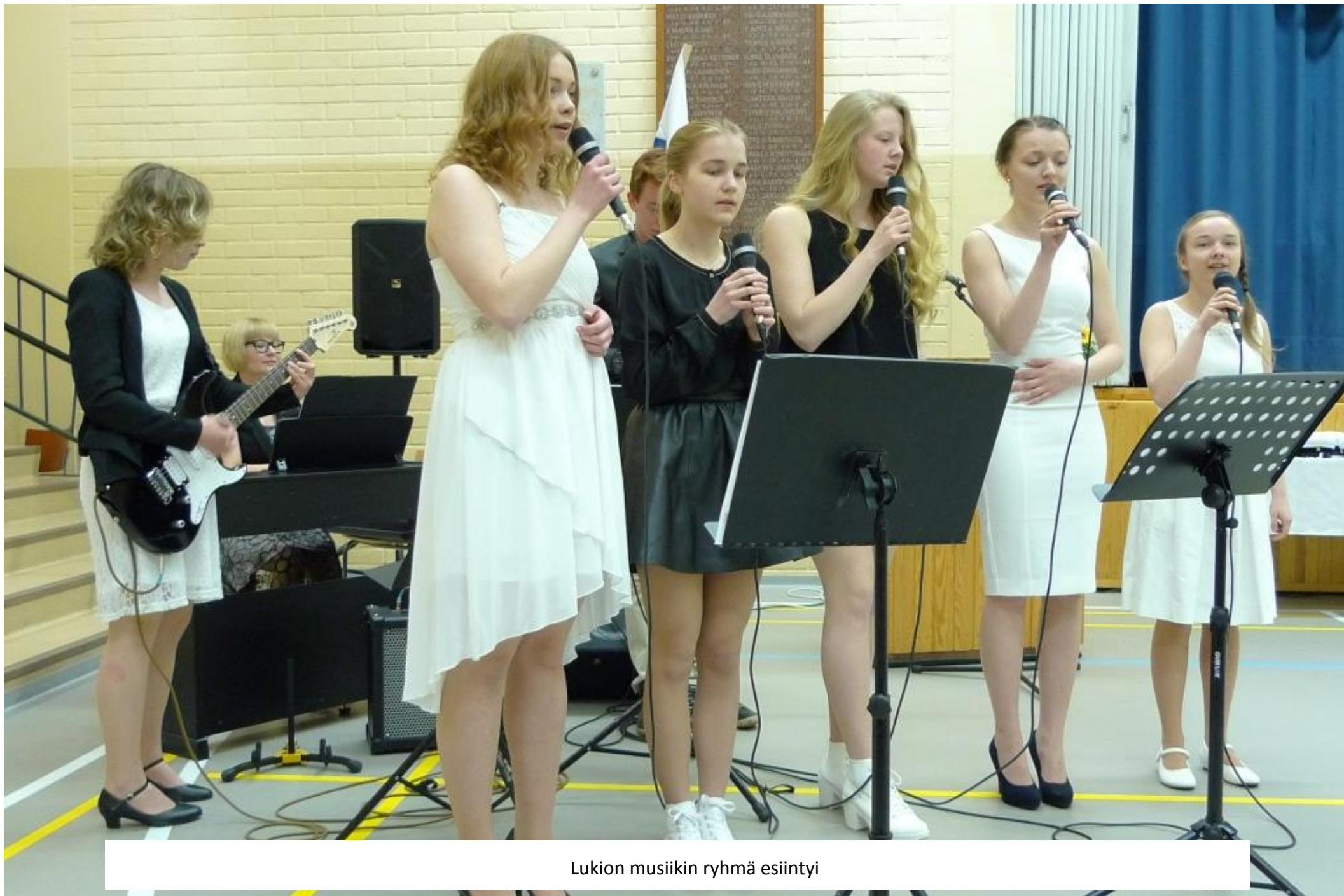
Lukion musiikin ryhmä esiintyi