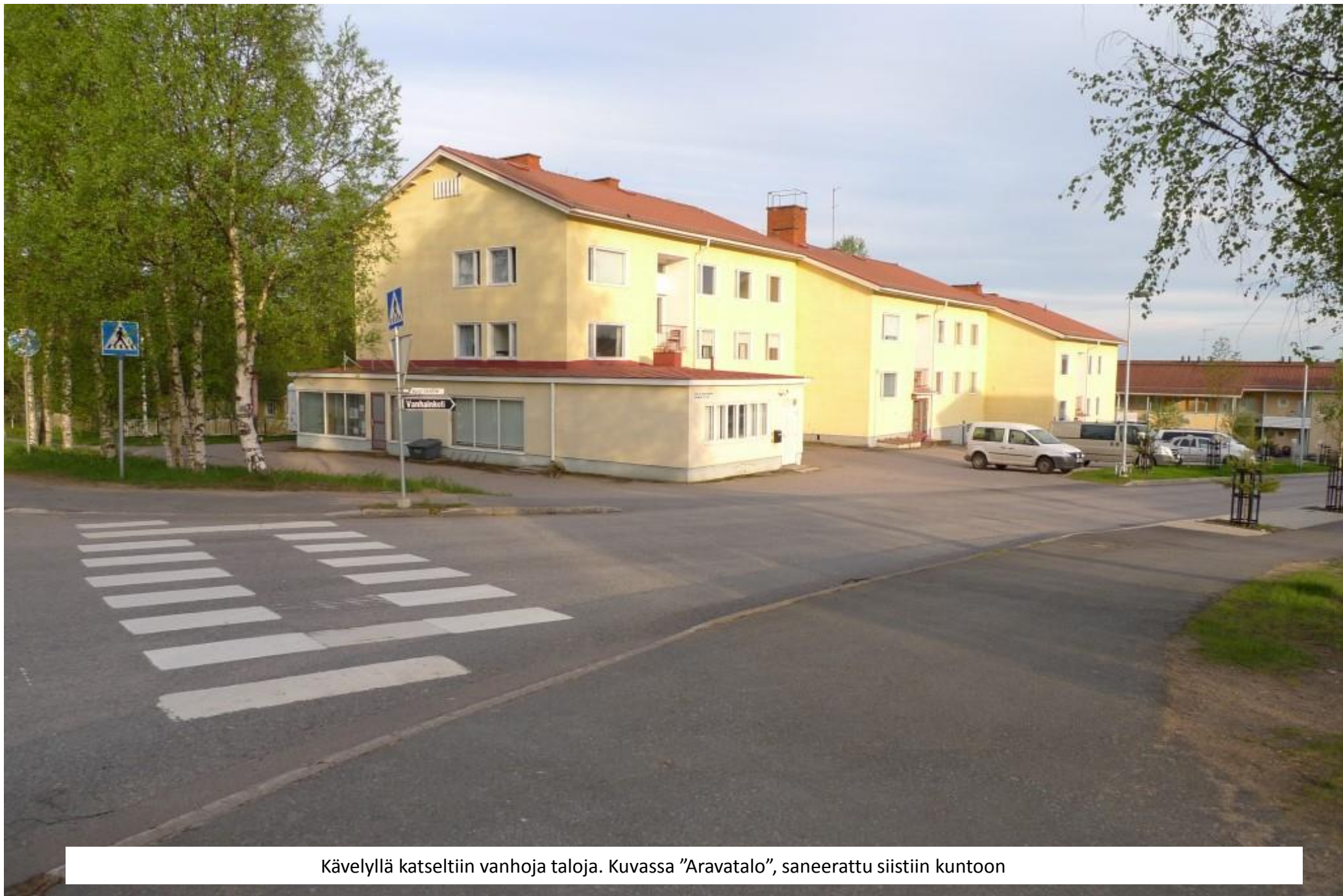
Kävelyllä katseltiin vanhoja taloja. Kuvassa "Aravatalo", saneerattu siistiin kuntoon