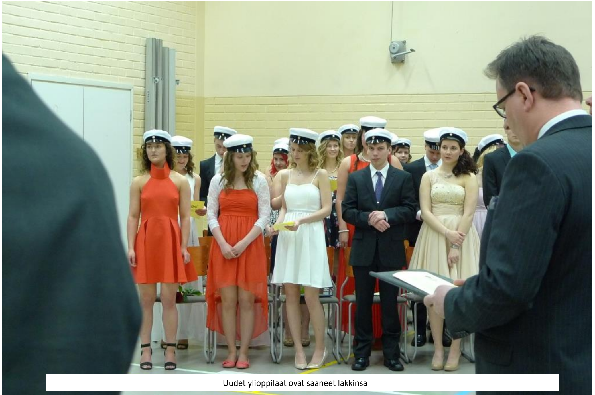
Uudet ylioppilaat ovat saaneet lakkinsa