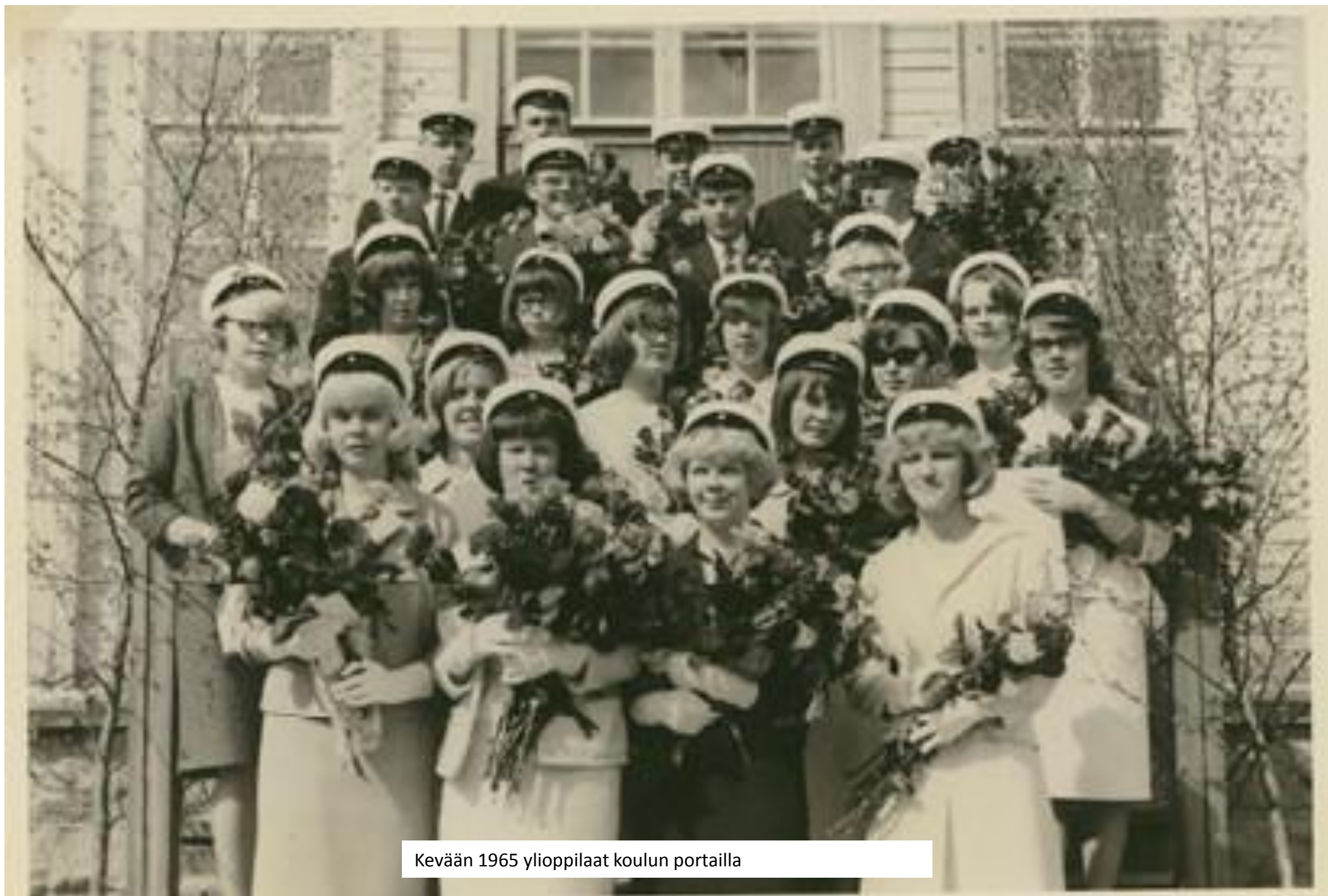
Kevään 1965 ylioppilaat koulun portailla