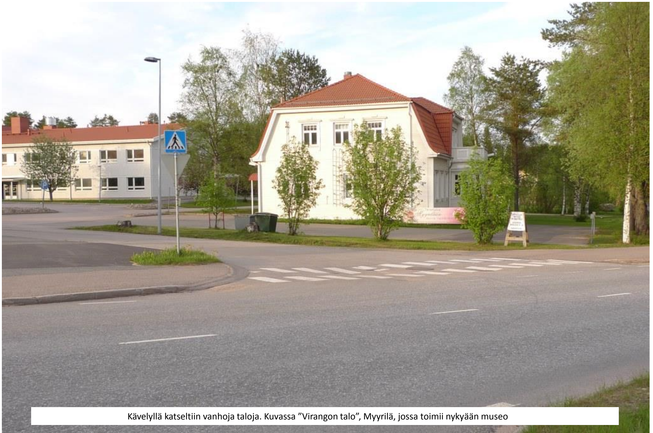
Kävelyllä katseltiin vanhoja taloja. Kuvassa "Virangon talo", Myrtilä, jossa toimii nykyään museo