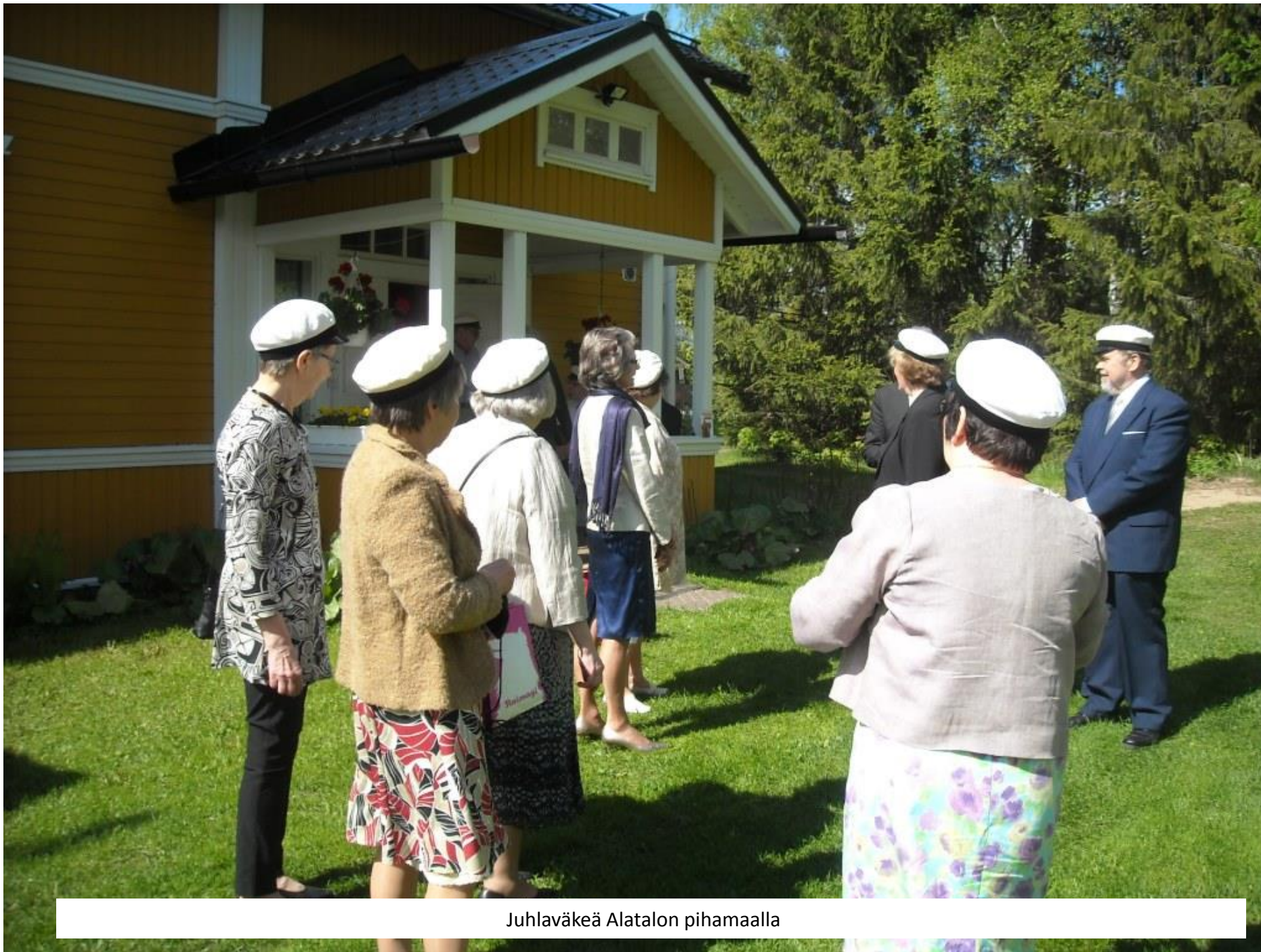
Juhlaväkeä Alatalon pihamaalla