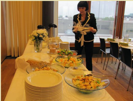
Illtapala oli maukasta ja esillepano näyttävä