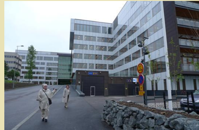
Tapiola-ryhmän uusi toimitalo on Espoon suurin toimistorakennus